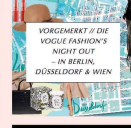
VORGERÄT // DIE VOGUE FASHION'S NIGHT OUT – IN BERLIN, DÜSSELDORF & WIEN